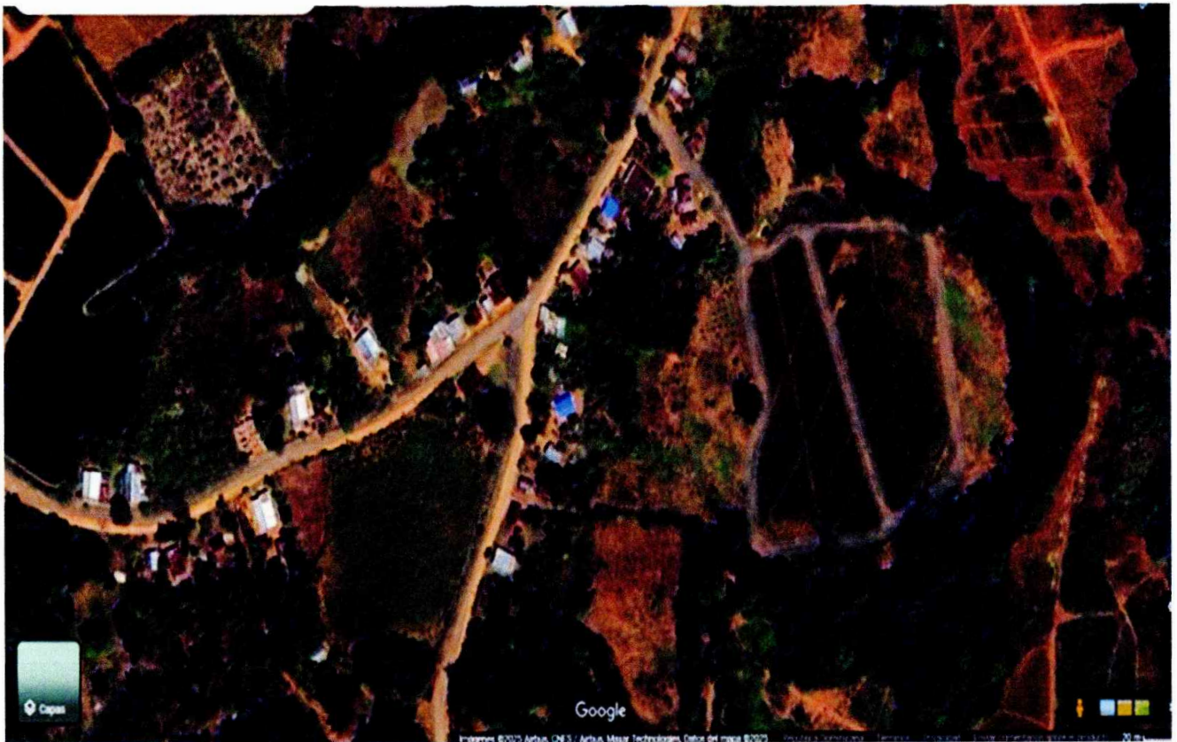
Ubicación Geográfica: 18.970078, -69.997082